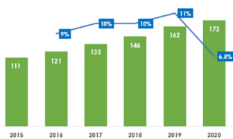
베트남 소매시장 규모 추이(2015~2020년) (단위: US$ 십억, %)

2020년 베트남의 소매시장 규모는 코로나19의 영향에도 불구하고 1,720억 달러로 전년 대비 6.8% 성장을 기록했다. 베트남의 소매시장은 2016년부터 2019년까지 4년연속으로 10% 내외의 높은 성장률을 기록했으며, 가장 큰 비중을 차지하는 것은 식음료 분야로, 약 30%를 차지한다.